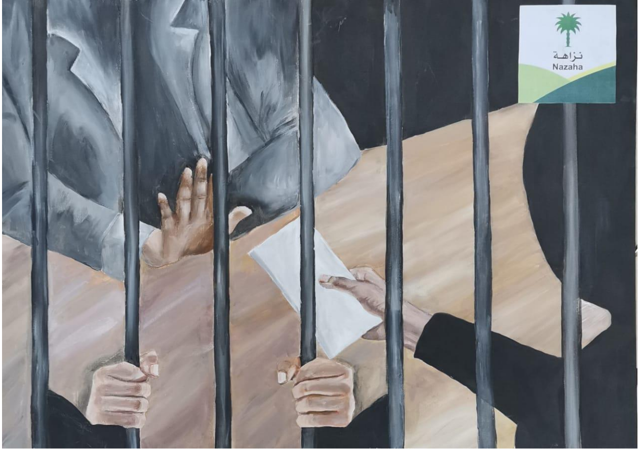
عمل الطالبة / هديل سهل الحارثي