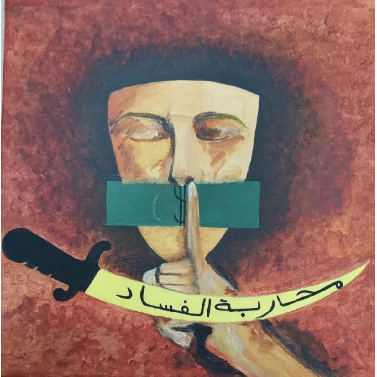
عمل الطالبة / بدرية عيد الحارثي